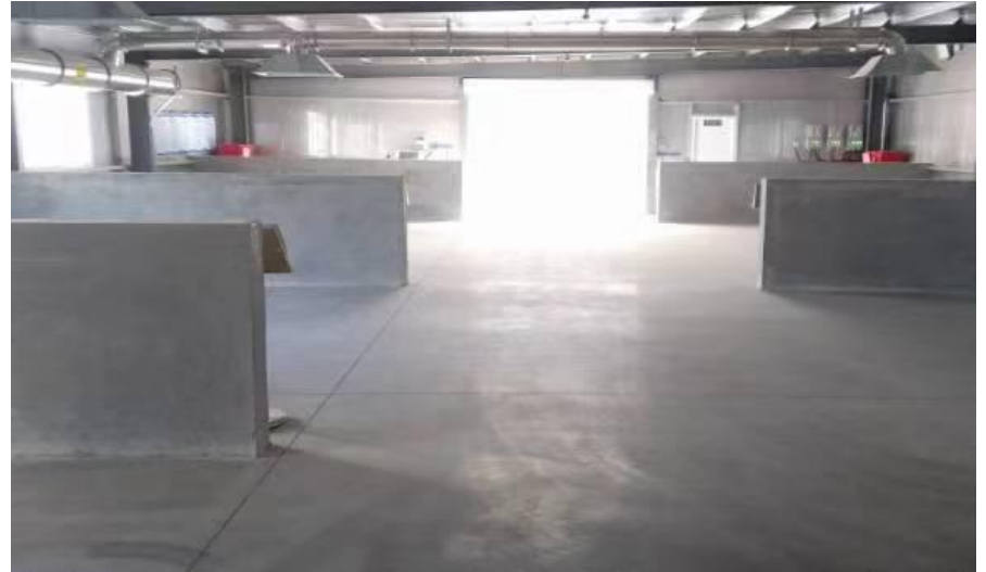
附图 5 危废暂存间现场照片