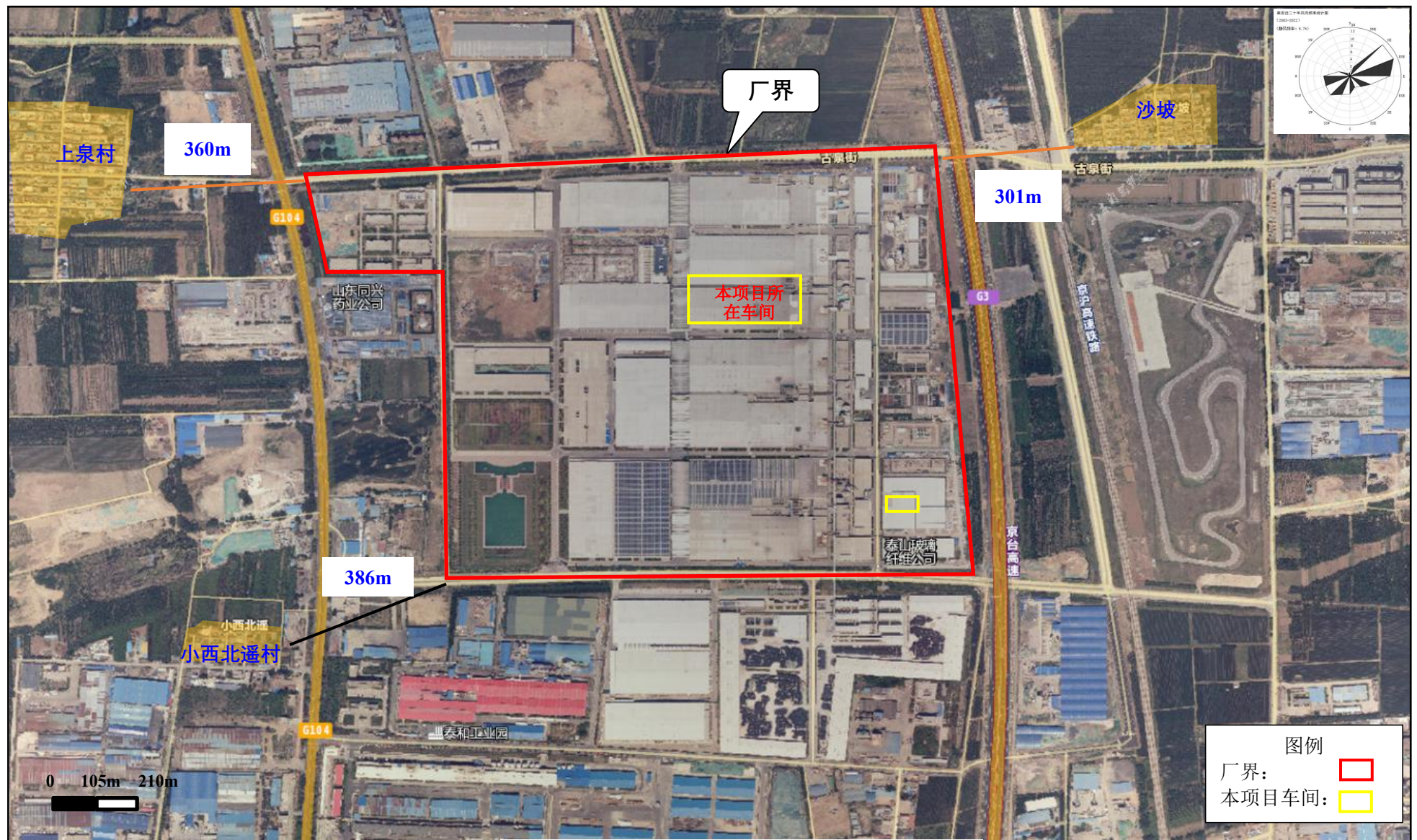
附图4 项目周边敏感目标图